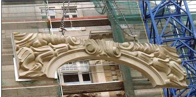
Montage-Modulsystem historischer Giebel

Wiederherstellung historischer Dachlandschaft